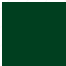
VERDE MÍSTICO Y23000C105370