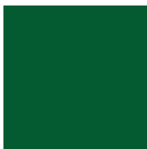
VERDE JOHN DEERE Y23000C620670