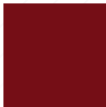
ROJO ROYAL Y23000C111870