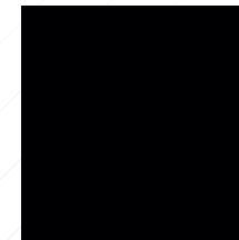
NEGRO RÁPIDO Y23000C090370